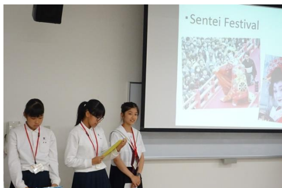
ピッツバーグで披露した「下関紹介」