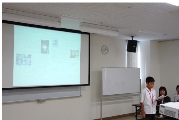
団員が課題成果やHS体験談を発表