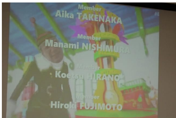
編集した映像を上映し終了!!