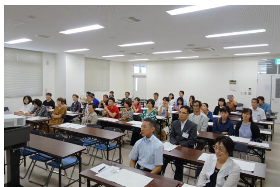
保護者の皆さんをはじめ多くの方が参加