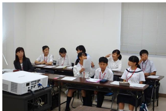
リハーサルもしたし、準備OK♪