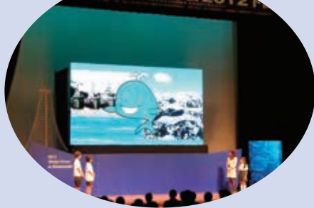
全国鯨フォーラム2012下関

保健福祉の分野では、小児救急医療啓発用ガイドブックを作成し、中学生以下の子どもがいる家庭に配布するとともに、公共施設へのAEDの整備を計画的に進めるなど、保健医療の充実を図りました。