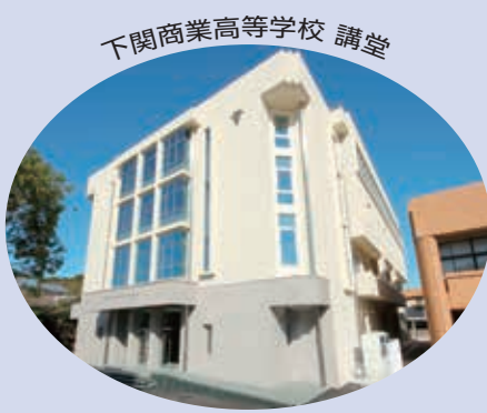
下関商業高等学校 講堂

教育の分野では、老朽化していた下関商業高等学校の講堂改築工事が完了した他、小中学校の耐震補強工事15棟、耐震診断15棟、補強計画の策定43棟、実設計の策定18棟を計画的に実施し、安全で安心できる学習環境の整備・充実を図りました。