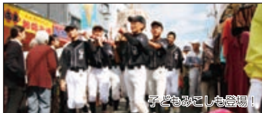
子どもみこしも登場！