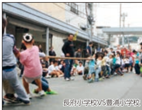
長府小学校VS豊浦小学校