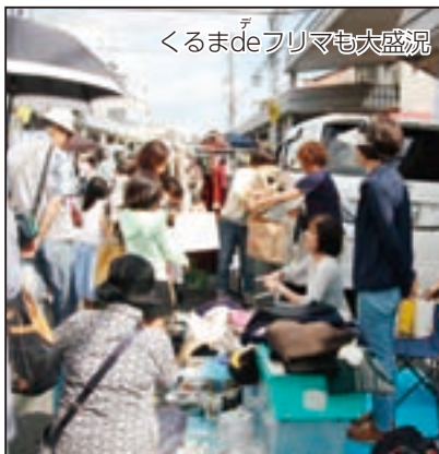
くるまdeフリマも大盛況