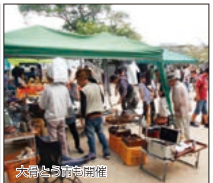
大骨とう市も開催