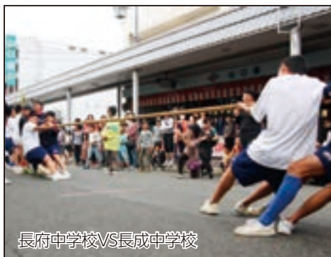
長府中学校VS長成中学校