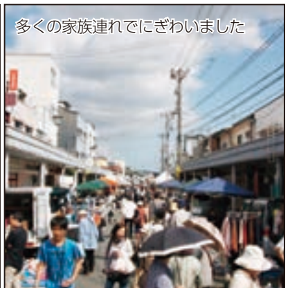
多くの家族連れでにぎわいました