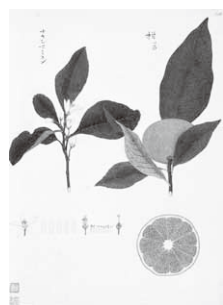
▲川原慶賀「ウンシュウミカン」ロシア科学アカデミー図書館蔵(Russian Academy of Sciences Library) St.Petersburg 2017