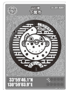
マンホールカード

田 8月31日(土)午前10時～午後4時 田 山陽終末処理場 田 終末処理場の案内、ヨーヨー釣り、スーパーボールすくい、パネル展示など ※アンケートに回答した方には、マンホールカードなどをプレゼントします!! 関上下水道局企画総務課 (☎231-8754)