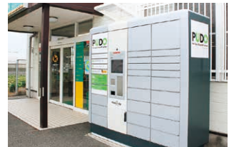
オープン型宅配便ロッカー「PUDO」 (ヤマト運輸 下関垢田センター)

宅 配便の再配達を減らすことは、CO 2 削減にもつながります。荷物が届く時に都合のよい日時を指定する、コンビニや宅配便ロッカーで受け取る、など、好きな時に、好きな場所で受け取れるサービスを活用することが再配達の削減になります！