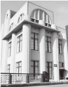
田中絹代ぶんか館