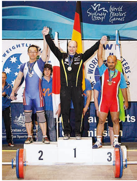
◀2009年、オーストラリアのシドニーで開催されたマスターズゲームでは世界2位に輝く。

▶天然温泉銭湯「日出温泉」の店主の顔も。「故障した時はどう対処すればよいのか、体のメンテナンスの仕方があるので、ひざや肩の痛みのあるお客さまには、ストレッチの仕方などアドバイスをすることもあります」