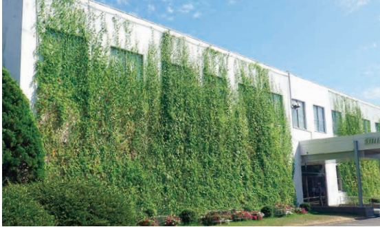
ブリヂストン下関工場 正面玄関前