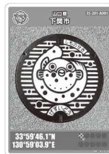
マンホールカード

閩8月31日(土)午前10時～午後4時 所山陽終末処理場 閩終末処理場の案内、ヨーヨー釣り、スーパーボールすくい、パネル展示など ※アンケートに回答した方には、マンホールカードなどをプレゼントします!! 閩上下水道局企画総務課 (☎231-8754)