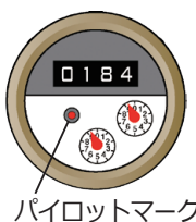
パイロットマーク

水道メータから蛇口までの間で漏水した水は、水道料金に加えられます。漏水がないか調べてみましょう。▷家の蛇口をすべて閉め、水道メータを見ます。パイロットマーク(〇)が回っていたら漏水しています。漏水箇所が分かる場合は、上下水道局指定の給水装置工事業者に修理の依頼を(修理費用は、自己負担)。漏水箇所が不明な場合は上下水道局に連絡を。 〇〇上下水道局給水課(☎231-3115)、北部事務所(☎772-2410)