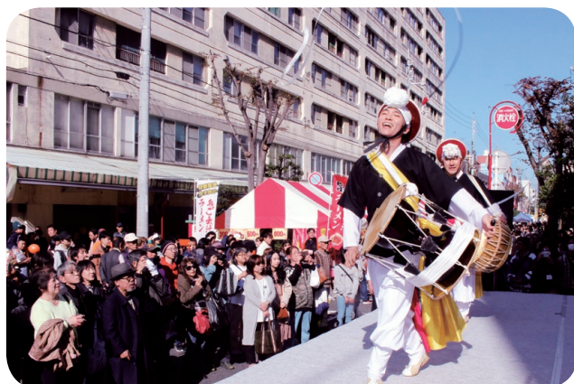
▲リトル釜山フェスタ(グリーンモール商店街)