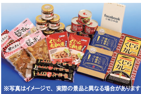
※写真はイメージで、実際の景品と異なる場合があります