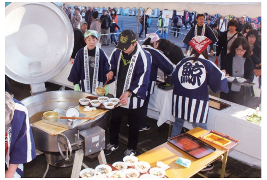
▲下関さかな祭でのくじら鍋。多くの人が行列に。