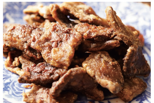
▲くじらの竜田揚げ