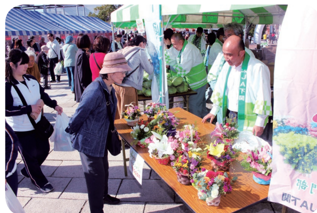
▲下関農業まつり(オーヴィジョン海峡ゆめ広場)