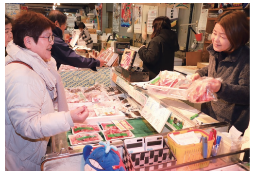
▲鯨肉を求めてにぎわう唐戸市場。