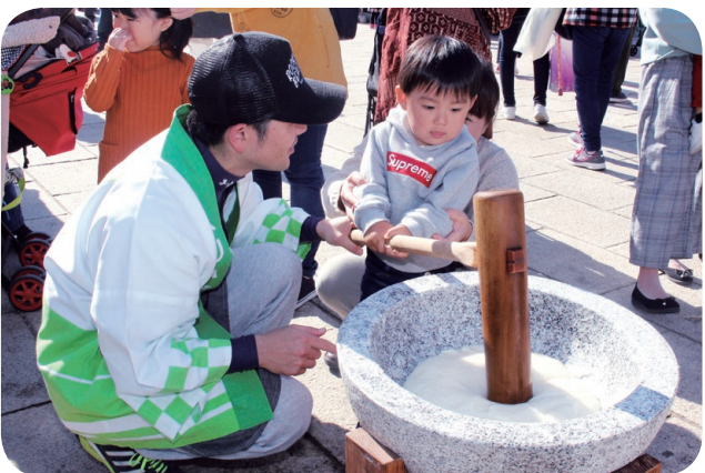
▲下関農業まつり(オーヴィジョン海峡ゆめ広場)