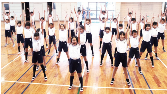
▲指先や体幹を意識し、動きをそろえて体操を行います。

一昨年にかんば生命特別賞を受賞した初代を引き継ぎ、昨年の6月に6年生の有志を募り、二代目澆刺隊を結成。全国1位を目指して練習をスタートしました。DVDや動画をみんなで何度も視聴