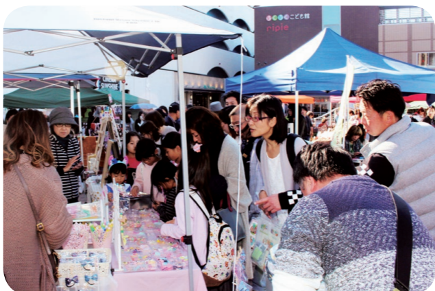
▲エキマチ下関オータムフェスタ(日本セレモニーウォーク)