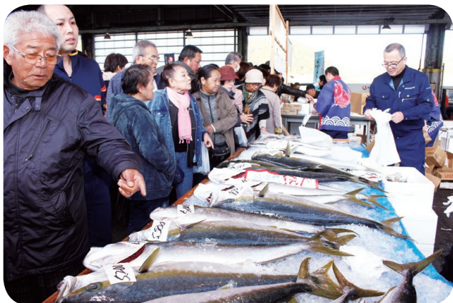
▲下関さかな祭(下関漁港)