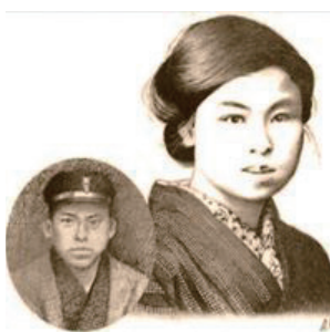
▲金子みすゞ・雅輔