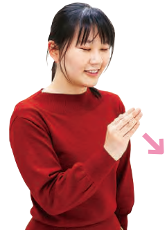
②握った右手を開きながら額の前から斜めに下げる