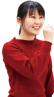
①右手を鼻先で握る