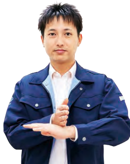
①右手の側面を左手の甲に添える