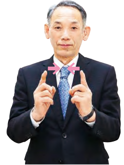
②両手の人差し指を立てて近づける