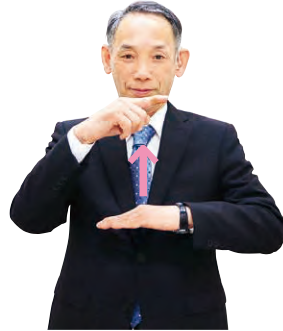
①左手の甲に添えた右手を引き上げながら人差し指以外を握る