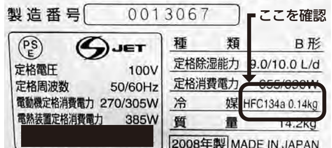
(記載例) フロンガスを使用している除湿機