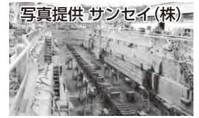
写真提供 サンセイ(株) ▲旧林兼造船ドック(現サンセイ(株))

下関は南氷洋捕鯨基地として、多くの捕鯨船や鯨肉の運搬を担う仲積船等が建造され、その修繕基地としての役割も担っていました。当時の建造記録等をたどると、戦後、下関で建造された捕鯨船等は40隻以上にもものぼり、入出港する捕鯨船や鯨肉を陸揚げする仲積船等で下関漁港は大いににぎわっていました。これらの多くの船は、マルハの関連会社でもあった旧林兼造船で建造され、船舶の艤装や修繕は、下関漁港内のドックで行われていました。戦前に造られた旧林兼造船のドックは、調査捕鯨時には目視採集船の、商業捕鯨再開後は捕鯨船の修繕ドックとして今も使用されています。圖下関くじら文化振興室