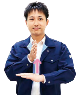
②左手の甲に添えた右手を上げる