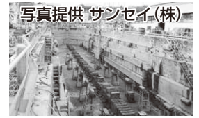
▲旧林兼造船ドック(現サンセイ(株))

下関は南氷洋捕鯨基地として、多くの捕鯨船や鯨肉の運搬を担う仲積船等が建造され、その修繕基地としての役割も担っていました。当時の建造記録等をたどると、戦後、下関で建造された捕鯨船等は40隻以上にものぼり、入出港する捕鯨船や鯨肉を陸揚げする仲積船等で下関漁港は大いににぎわっていました。これらの多くの船は、マルハの関連会社でもあった旧林兼造船で建造され、船舶の艤装や修繕は、下関漁港内のドックで行われていました。戦前に造られた旧林兼造船のドックは、調査捕鯨時には目視採集船の、商業捕鯨再開後は捕鯨船の修繕ドックとして今も使用されています。圖下関くじら文化振興室