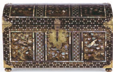
▲花鳥紋蒔絵螺鈿洋櫃