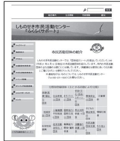
▲しものせき市民活動センターホームページ団体紹介