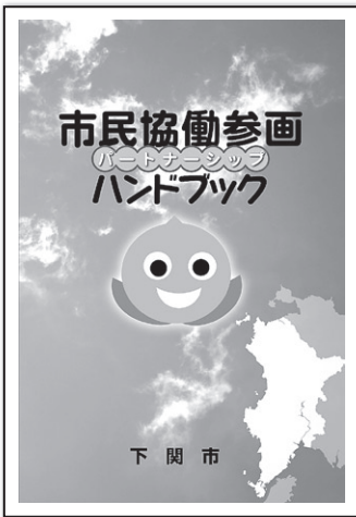
▲市民協働参画ハンドブック