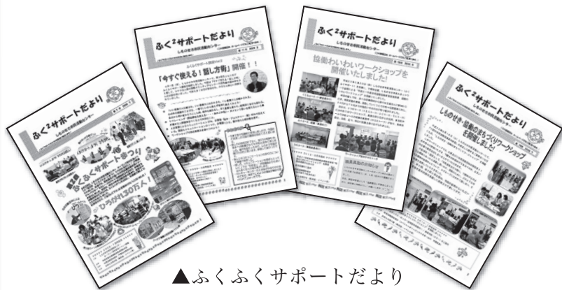
▲ふくふくサポートだより