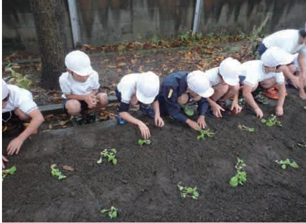
【出前講座（菜の花植付）の様子】