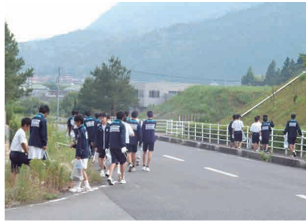
【豊田ぼたる街道一斉清掃】