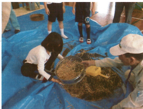
【出前講座（菜種収穫体験）の様子】

平成27年度からは、市内小学校の学校花壇などを利用した出前講座として実施しており、平成29年度に菜の花の植付けを行った2校が収穫や搾油体験を行うとともに、平成30年度は新たに3校が菜の花の植付けを行いました。