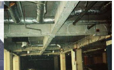
鉄骨を被覆して保護 石綿含有耐火被覆材