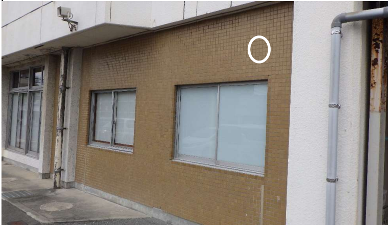
北部公民館 ②外壁：47角タイル