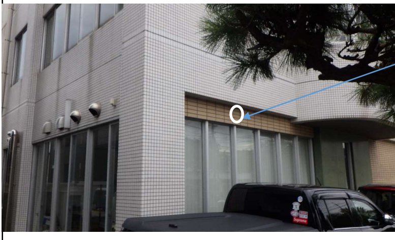
北部公民館 ④外壁：二丁掛タイル