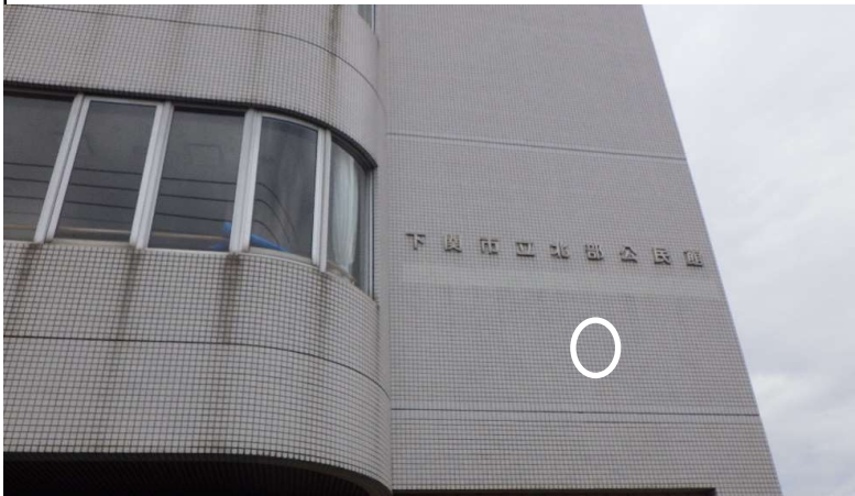
北部公民館 ③外壁：47角タイル