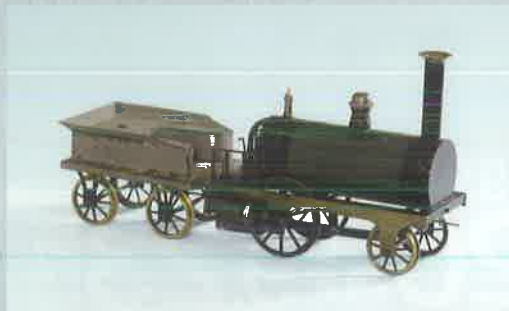
蒸気車模型興丸号 [萩博物館蔵]