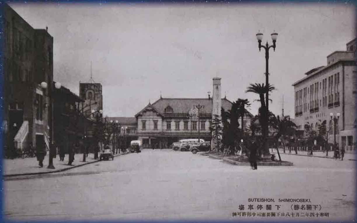
SUTEISHON, SHIMONOSEKI. 場車停関下 (歴名関下) 許可許部令司憲要関下日八十月二年四十和昭