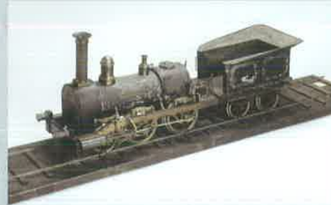
蒸気車模型ナポレオン号 [山口県立山口博物館蔵]