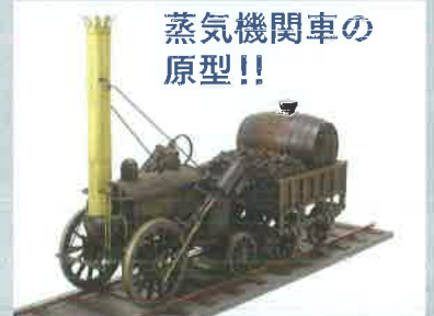
ロケット号模型 [鉄道博物館蔵]