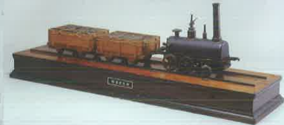
蒸気車模型 [錫島報効会蔵]