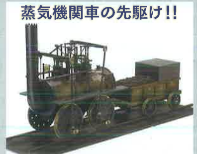
ロコモーション号模型 [鉄道博物館蔵]