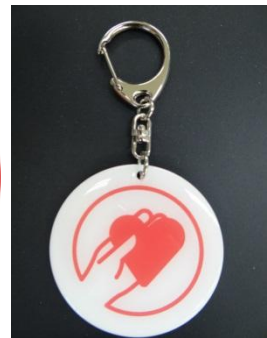
キーホルダー（直径 60mm、アクリル製）