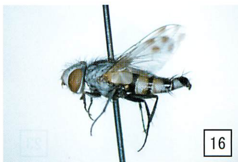
9. ペキンニクバエ♂交尾器； 10. オオニクバエ♂交尾器； 11. ドロバチヤドリニクバエ♂交尾器； 12. ギンガクヤドリニクバエ♂背面； 13. ギンガクヤドリニクバエ♂交尾器； 14. ヒコサンギンガクニクバエ♂背面； 15. ヒコサンギンガクニクバエ♂交尾器； 16. ハネボシスナニクバエ♂側面