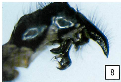
1. カヤニクバエ♂交尾器； 2. コニクバエ♂交尾器； 3. ホリニクバエ♂交尾器； 4. ジョセフニクバエ♂交尾器； 5. ヒメニクバエ♂交尾器； 6. フィールドニクバエ♂交尾器； 7. ホクリクニクバエ♂交尾器； 8. カワユニクバエ♂交尾器。