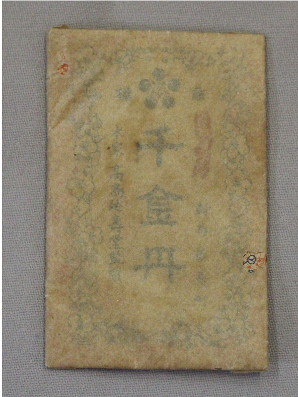
写真2 長崎県の置き薬(薬4-3)