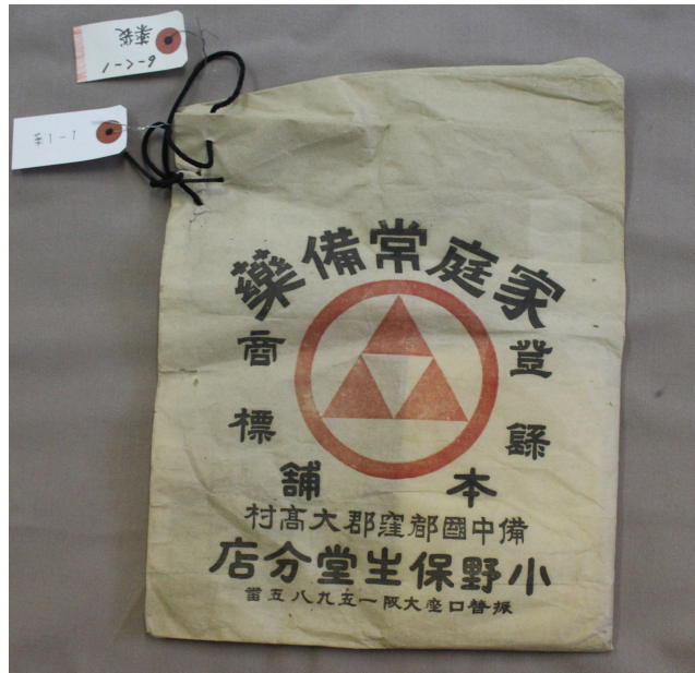
写真5 薬1(薬番号は表1の整理番号に該当する。以下同様。)