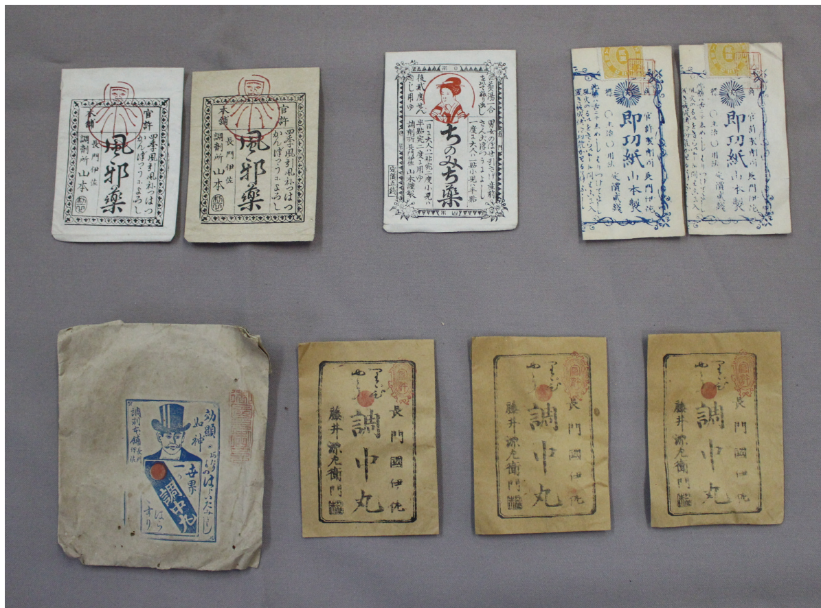
写真4 伊佐の置き薬(上段左から薬2-5、2-6、2-4、下段左から薬19-1、19-2)