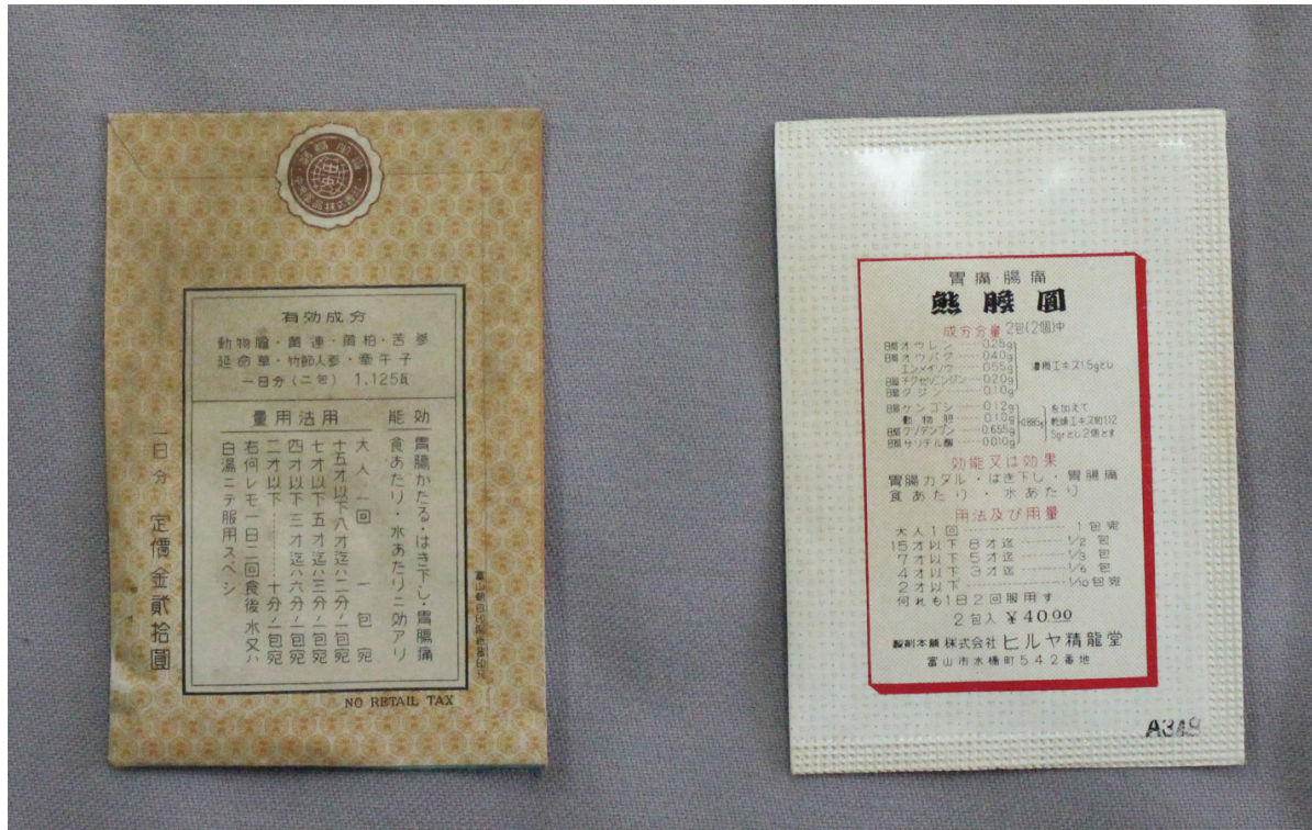
写真1 薬の封じ方(左:封筒型 右:三面封)

すべての項目で収蔵品に記載がない項目にはハイフン(ー)を入れており、筆者推測のものは「～か」としている。数字の表記は収蔵品に記載されているとおりである。置き薬は明治15年に売薬印紙税規則が定められ、薬には定価を記載し定価に応じた印紙を貼らなければならなかった。この規則は大正15年に廃税されるまで続いた(奈良県薬業史編さん審議会編1991、富山県編1987)。「印紙」欄は印紙が添付されているものに○をつけている。「年代」は、個々の収蔵品の特徴や一緒に収蔵されたものなどから筆者推測で記載している。表は預け箱・預け袋があるものを先に、薬のみのものを後に記載し、年代が古い順に並べている。