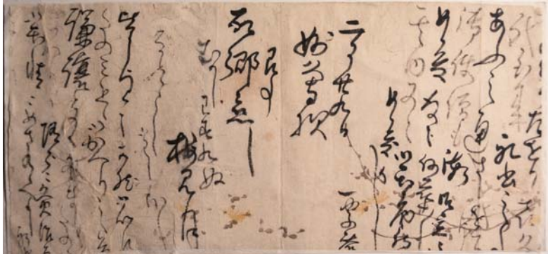
「故郷恋しむかしわすれぬ梅見月」