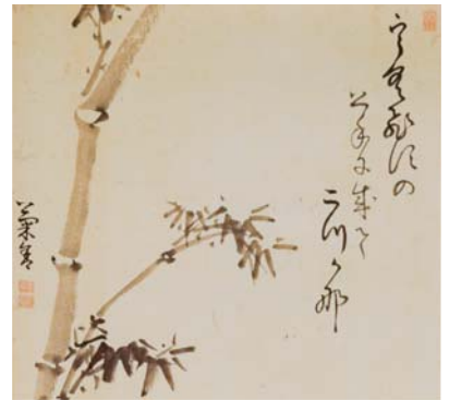
「うぐひすの上手に成て二つかな」