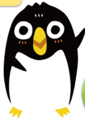
(下関市環境部PRキャラクター「エコペン」)