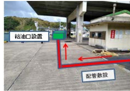
船舶給油設備増設