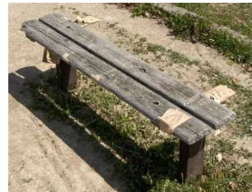
老朽化したベンチ

老朽化した四阿・ベンチの更新 45,000千円 山中町なかよし児童公園、さつきヶ丘第2児童公園 一の宮公園 等 傷んだ遊具等の補修 5,000千円