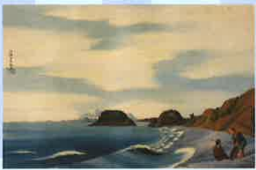
司馬江漢《七里ヶ浜図》江戸時代後期、大和文華館蔵 ※展示は半期のみ

本展では江戸時代後期から昭和初期の日本の風景表現を通して、日本人の自然を見る眼のうつり変わりをたどります。