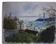
古舘充臣資料より※