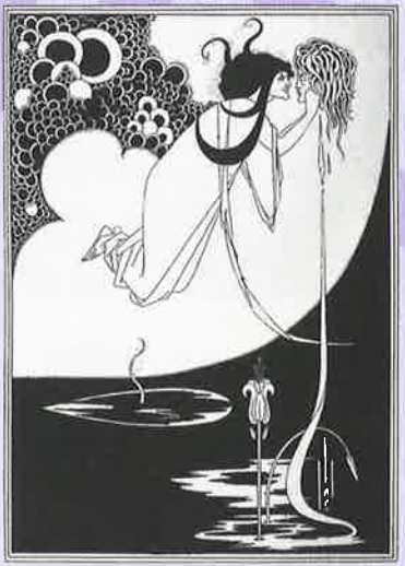
オーブリー・ビアズリー「サロメ」より 《クライマックス》1894年、熊本県立美術館蔵 ※展示は半期のみ

Legacy of Beardsley; Artists of Art Nouveau and Painters of Japanese Modern Art