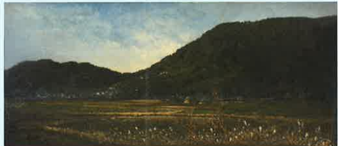
高橋由一《琴平山遠望図》明治14年(1881)、金刀比羅宮蔵