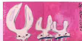
富田一男『こんこんやまのこうさぎは』より