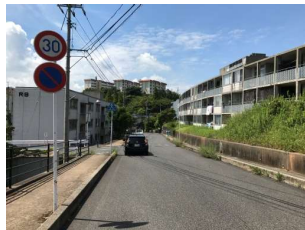
①市道一号線からR9を見る