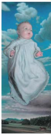
ぼくのおうちに遊びにおいでよ