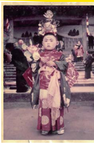
昭和37年頃 豊北町 妙久寺 「おちごさん」

小田善郎の描いたこどもと、芸術的な姿をした豊北町のこどもが、大正レトロなかつての小学校にあつまりました。BGMはこどもの遊ぶ声でいっぱい！ 太翔館の持つ意外なアート空間を、ご家族で体感してみてください。