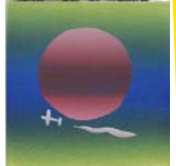
コロコロ版画作品例