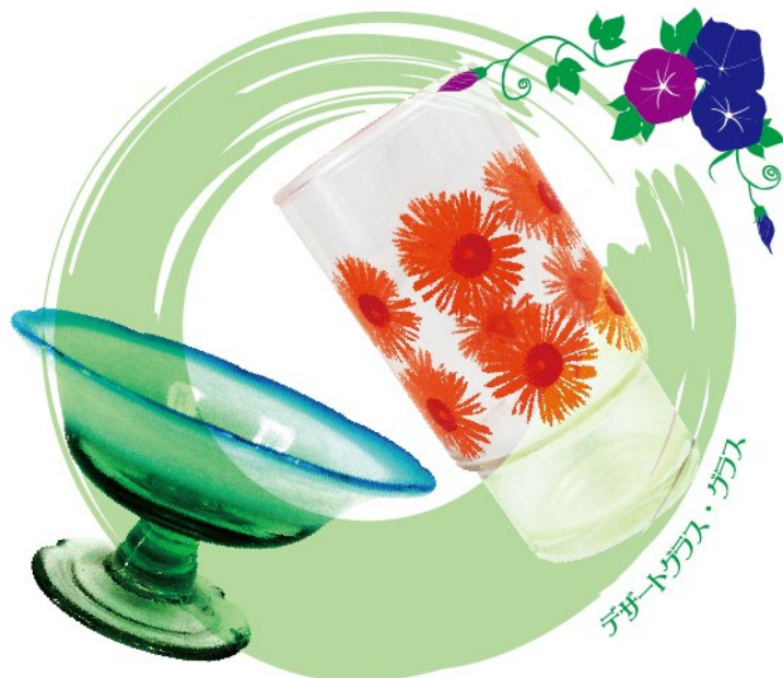
テザートガラス・ガラス