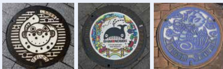
デザインマンホール (ふく・らじくん・青龍)

地下に埋設された設備を点検・管理する時、人の出入りに使用します。道路上に見えているのはそのフタで、いろいろなデザインがあります。