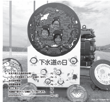
下関市上下水道局