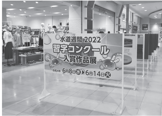
水道週間 習字コンクール 入賞作品展