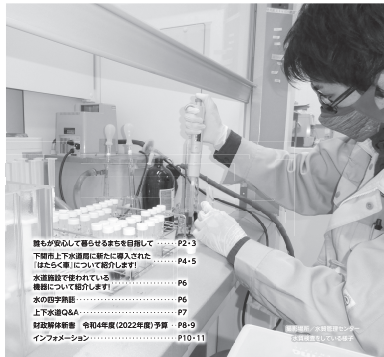
下関市上下水道局