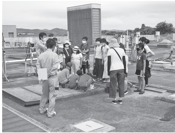
下水道展 施設見学