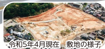
令和5年4月現在 敷地の様子