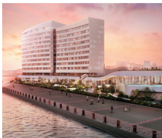
▲「リゾナーレ下関」イメージ図