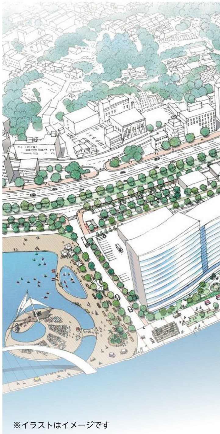
※イラストはイメージです