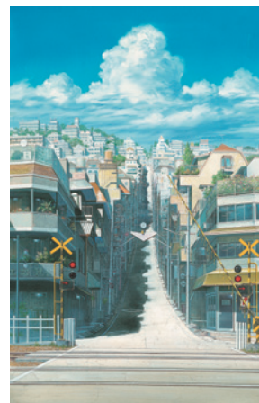
▲ 時をかける少女《踏切》2006年

料一般1,400円(1,200円)、大学生1,200円(1,000円) ※( )内は平日料金