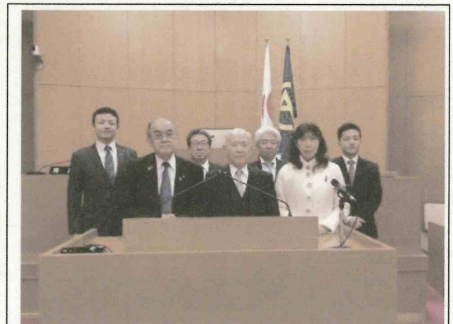
【宮崎市議会 議場を視察】