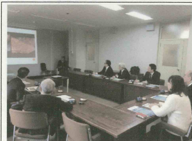
【宮崎市の説明を受ける】

A 1km圏内に既存の駐車場が5,500台、その稼働率が約53%であり、十分にまかなえると考えている。また、一義的には公共交通機関を利用していただき、さらに宿泊していただき、経済効果を生んでいくことが最優先だと考えている。