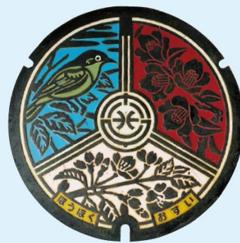
ツバキ・山桜・メジロ