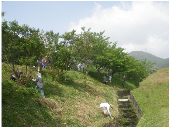
第12回(令和3年度)【景観まちづくり活動部門】 景観賞「日和山公園愛護会の活動」