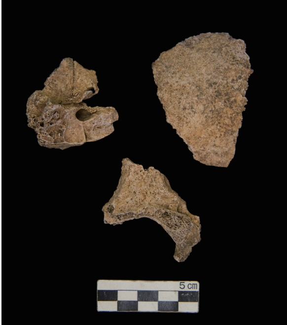
頭蓋 (The skull)