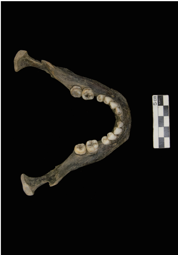
下顎骨 (The mandible)

(The skeleton SK-7 from the Mutabe site, young adult male)