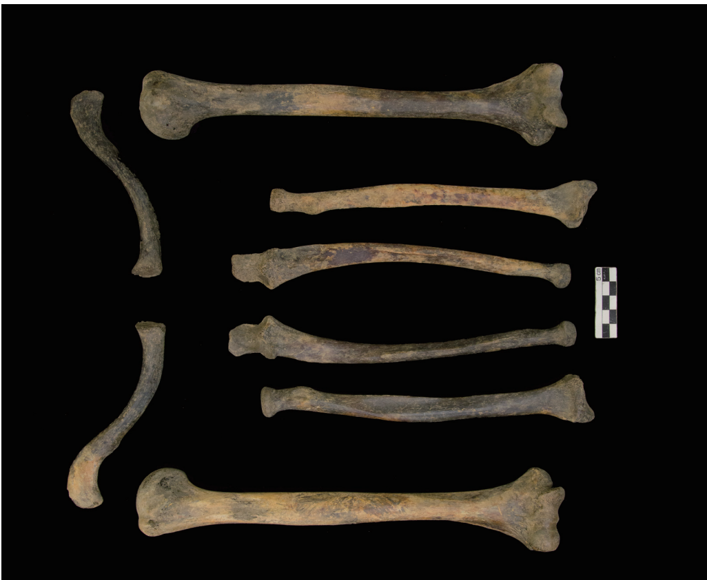
上肢骨 (Bones of the upper limb)