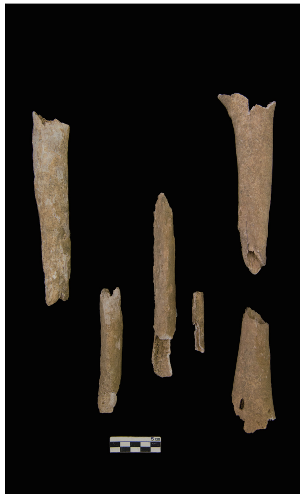
下肢骨 (Bones of the lower limb)