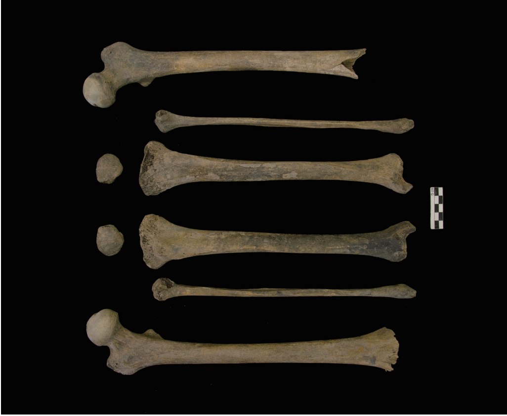
下肢骨 (Bones of the lower limb)

(The skeleton SK-8 from the Ishiike site, female unknown age)