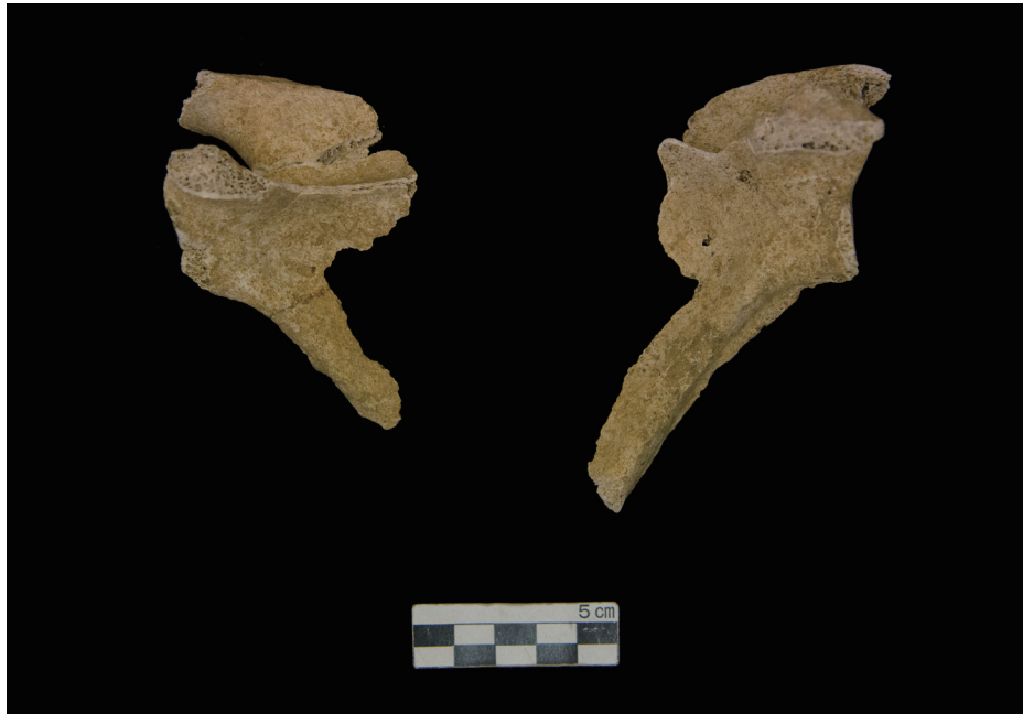
肩甲骨 (The Scapula)