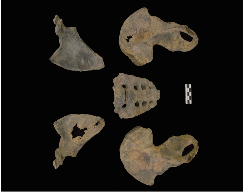
肩甲骨 (The Scapula) ・寛骨 (The Pelvis)