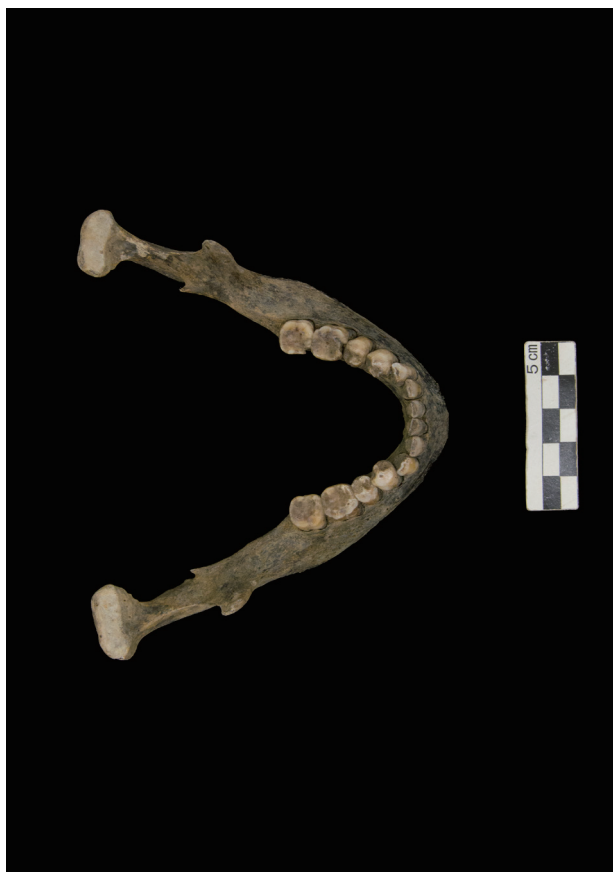
下顎骨 (The mandible)

(The skeleton SK-8 from the Ishiike site, female unknown age)