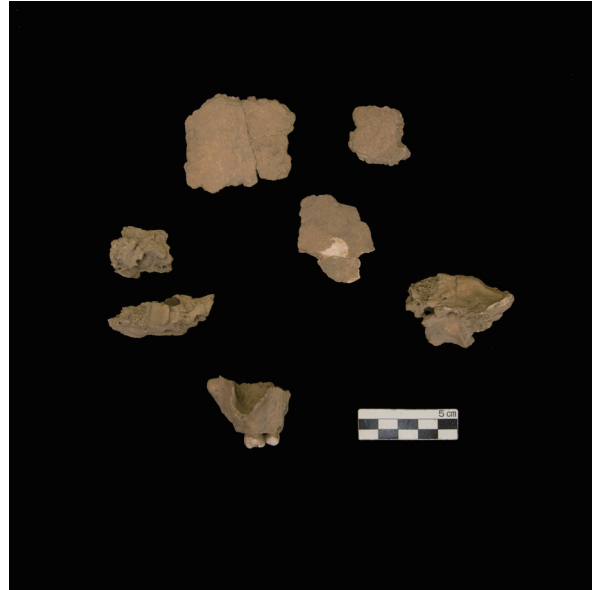
頭蓋左側面 ( Left lateral view of the skull)