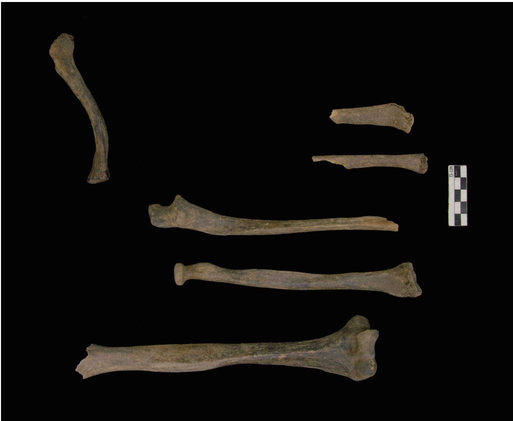
上肢骨 (Bones of the upper limb)