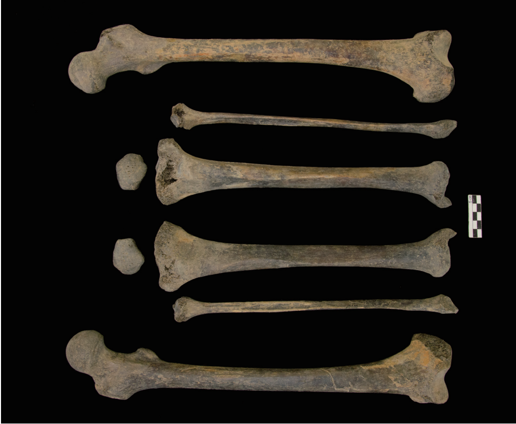
下肢骨 (Bones of the lower limb)