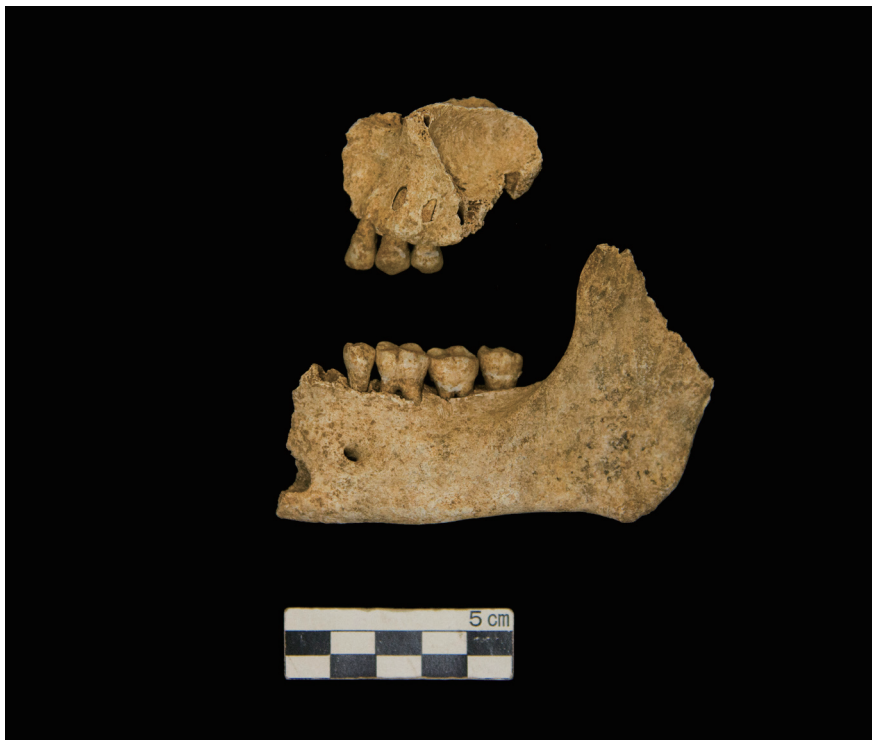
上顎骨・下顎骨 (The maxilla・The mandible)