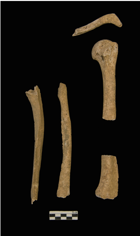
上肢骨 (Bones of the upper limb)