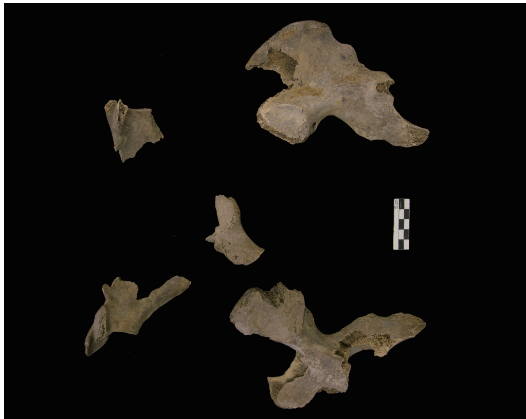
肩甲骨 (The Scapula) ・ 寛骨 (The Pelvis)