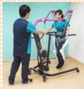
医療・健康福祉 関連研究