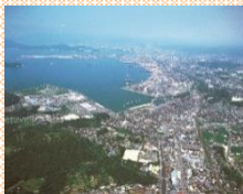
瀬戸内のコンビナート