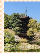
国宝 瑠璃光寺五重塔