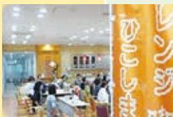
オレンジ喫茶ひこしま