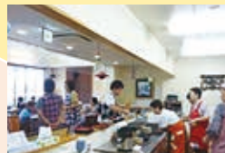
ケアタウン山の田