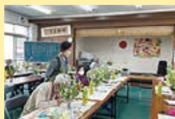
muku muku cafe