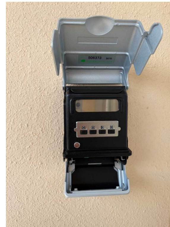
カギを取り出して カバーを閉める