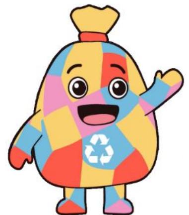
リサイクル推進キャラクター ミーゴ