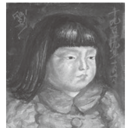
岸田劉生(外套の麗子) 1919年/河村コレクション