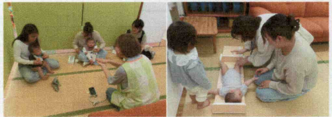
どらごんベイビーの会～0歳児さんおいでおいで～