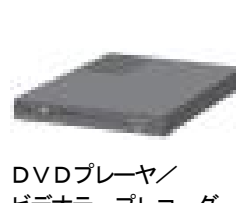
DVDプレーヤ/ ビデオテープレコーダ