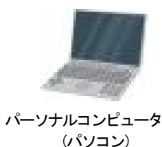
パーソナルコンピュータ (パソコン)