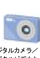
デジタルカメラ/ デジタルビデオカメラ