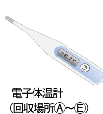
電子体温計 (回収場所(A~E))