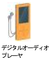
デジタルオーディオ プレーヤ