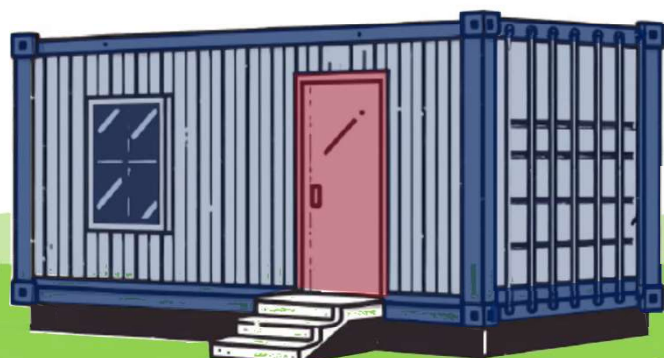
コンテナを利用した工作物