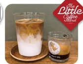
ザ・リトルコーヒースタンド