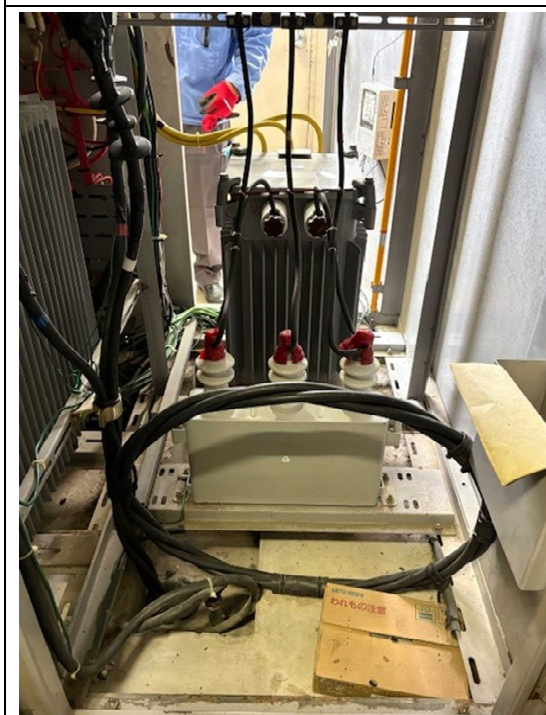
交換対象コンデンサ (要 PCB 検査)