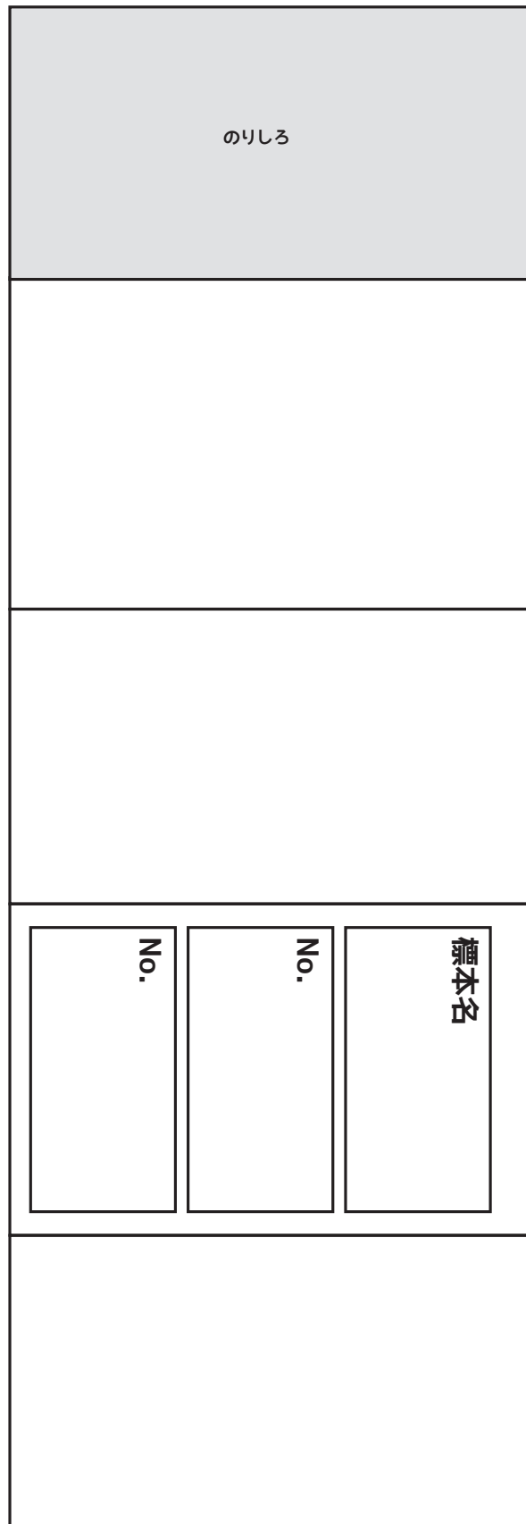
標本箱を収納する箱