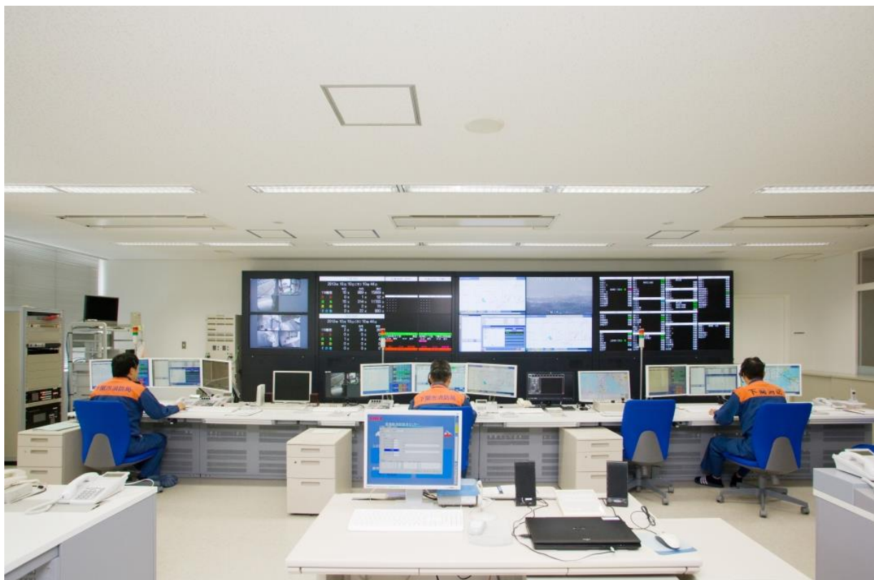
下関市・美祢市消防指令センター